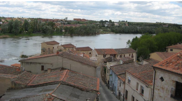
Zamora am Fluss Duero

Nördlich von Salamanca durchquert die Vía de la Plata eine mit riesigen Feldern und Weiden kultivierte, schier unendliche Ebene, fast baumlos, auf der die Blicke kaum Orientierungspunkte finden. Diese wasserarme Meseta erstreckt sich bis Zamora im Tal des Río Duero. Obwohl der Name der Stadt arabischer Herkunft ist, haben die Mauren nur wenige Merkmale hinterlassen, denn sie haben die Stadt zerstört. Nach ihrer Übernahme durch Ferdinand I. von Kastilien und León wurde sie von Christen neu besiedelt – und stark befestigt.