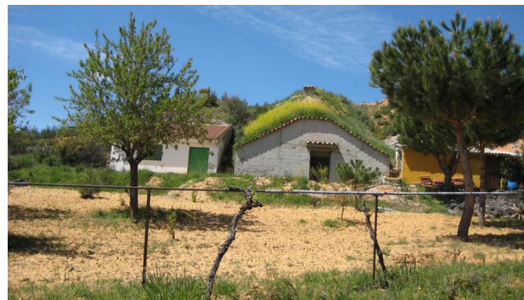
In den Hang gebaute Bodega bei Tábara

Kurz nach der Ortschaft Palacios de Sanabria trifft der Pilger bei Remesal auf eine Gedenktafel, die daran erinnert, dass in der Eremitage (Kapelle) dieser kleinen Ortschaft große Weltgeschichte geschrieben wurde. Hier traf sich 1506 Ferdinand II. von Aragon (der königliche Gatte der zwei Jahre zuvor verstorbenen Isabella von Kastilien) mit seinem Schwiegersohn Philipp, dem Schönen (von Kastilien), um die infolge von Isabellas frühem Tod ausgebrochenen Erbstreitigkeiten zu schlichten. Hier wurde ein Erbfolgekrieg abgewendet und bestätigt, dass Isabellas Erbe, so wie sie verfügt hatte, nicht an ihre Tochter Johanna gehen sollte, die als „la Loca“, die Wahnsinnige, in die Geschichte einging, sondern von Ferdinand verwaltet werden sollte. So konnte dieser noch zehn Jahre die beiden Königreiche Aragon und Kastilien in Personalunion regieren. Das wurden zum Wohle des sich vereinigenden Spaniens noch weitere 10 Jahre ohne