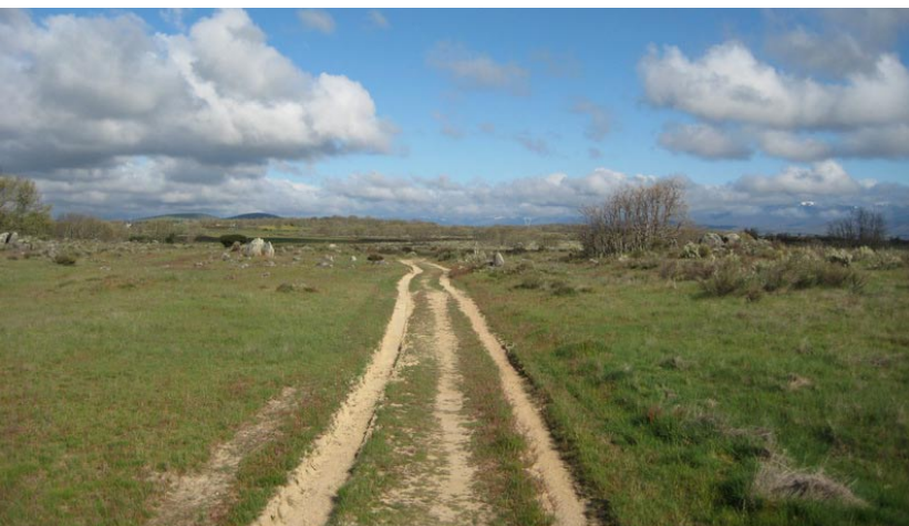
Durch weite Landschaften führt die Via de la Plata

426 n.Chr. wurde Hispalis von den Vandalen, 441 n.Chr. von den Westgoten und 712 n.Chr. von den Arabern erobert. Ab 1147 war sie Hauptstadt der maurischen Almohaden bis sie 100 Jahre später von Fernando III. von Kastilien für die Christenheit zurückgewonnen wurde. Dieser