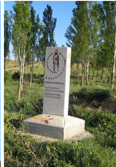
Die ältesten Jakobsfiguren (Bild links) findet man an der Via de la Plata ebenso wie neuzeitige Wegmarkierungen (Bild rechts).

ne“. Sie ist auch heute wieder eine Entwicklungsachse par excellence mit einer von der EG finanzierten modernen Autobahn und der Nationalstraße daneben, wie den Wanderwegen und Pfaden nach Santiago, die sich neben beiden hin- und herwinden.