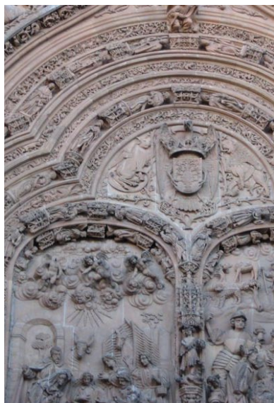
Links: Portal der alten Kathedrale in Salamanca; rechts: Details des Tympanons.

Cáceres: Für die Römer war die Stadt eine unter vielen. Während der Völkerwanderung und unter den Westgoten verlor sie an Bedeutung. Die Araber gaben ihr den Namen „Hizn Quazris“. Am 23. April 1229, am Vorabend des Tages des Heiligen Georg, der darob ihr Schutzpatron wurde, eroberte sie Alfonso IX. von León nach drei vergeblichen Anläufen.