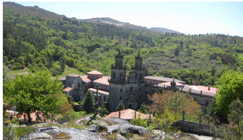
Das Kloster Santa Maria Oseira

Das in einem lieblichen Tal gelegene Monasterio de Santa Maria Oseira muss wegen seiner besonderen Geschichte erwähnt werden. Man hat es wegen seiner Lage und Größe auch den „galizischen Escorial“ genannt. Erste Urkunden belegen ab 1137 eine Gemeinschaft von vier Benediktinern. König Alfons VII. überschrieb ihnen umfangreiche Ländereien, die sie urbar machten und erfolgreich bewirtschafteten. Das gab dem Kloster enormen Auftrieb, vor allem als es sich den Regeln der damals attraktiven Zisterzienser unterstellte. Zu seiner Blütezeit hatte es allein 600 Mönche, ohne die Laienbrüder, ein Kosmos an Wirtschaftskraft, Geist und Wissenschaft, der das karge Umland bereicherte. 1835 wurden in Spanien die